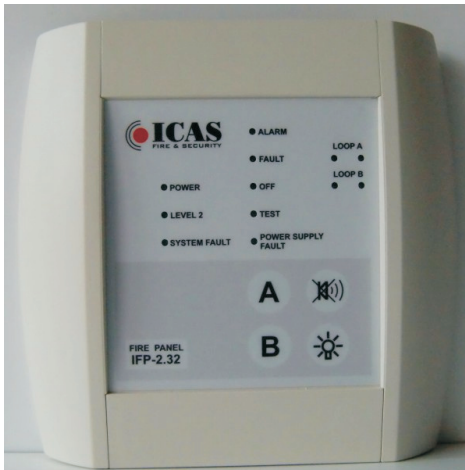
Icas brandcentral, type IFP-2.32