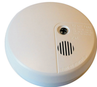
Icas Branddetektor: 500-IDx (x=O, I, T) O: Optisk, I: Ionisk, T: Termisk Siren integrerat: 85db/3m

Enkel installation: Bara 2 trådar från centralen till detektorerna. Använder du Icas detektorer 500-IDX, kopplar man 4 trådar till den integrerade sockelsirenen.